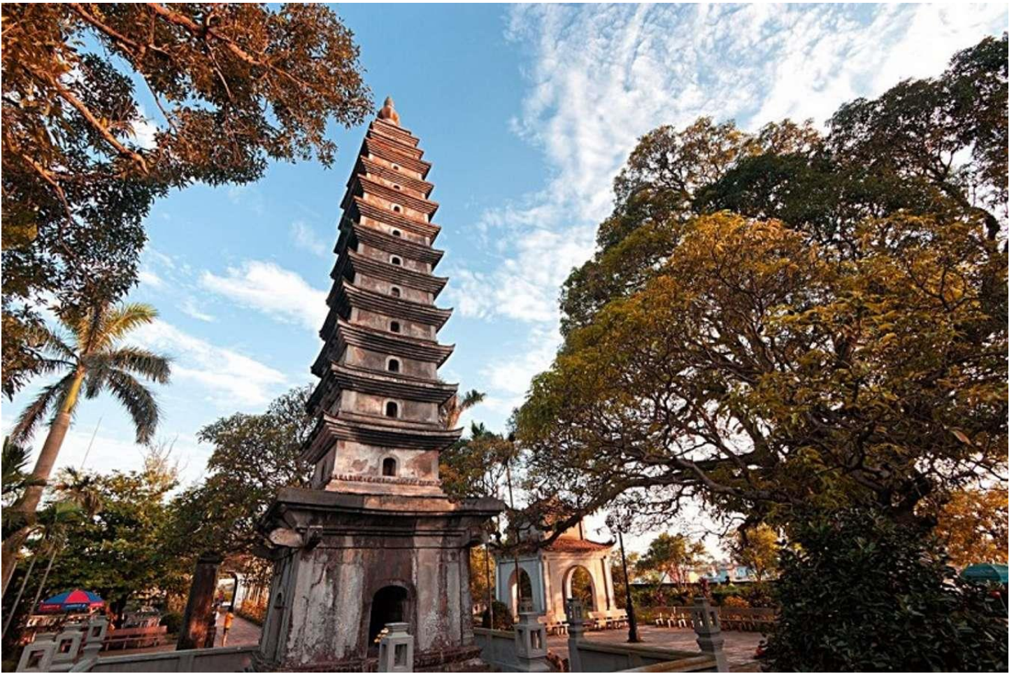
Tháp Phổ Minh - tòa tháp gần 1000 năm tuổi ở Nam Định.