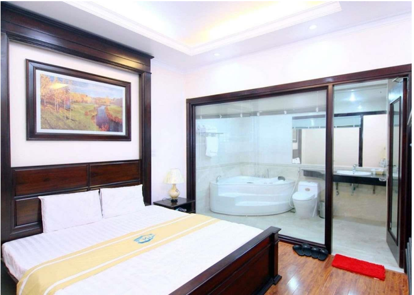
Không gian phòng nghỉ ở khách sạn Lakeside 2. @lakesidehotelnd.com.vn