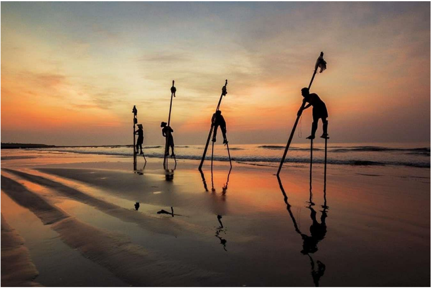
Biển Thịnh Long chiều hoàng hôn.