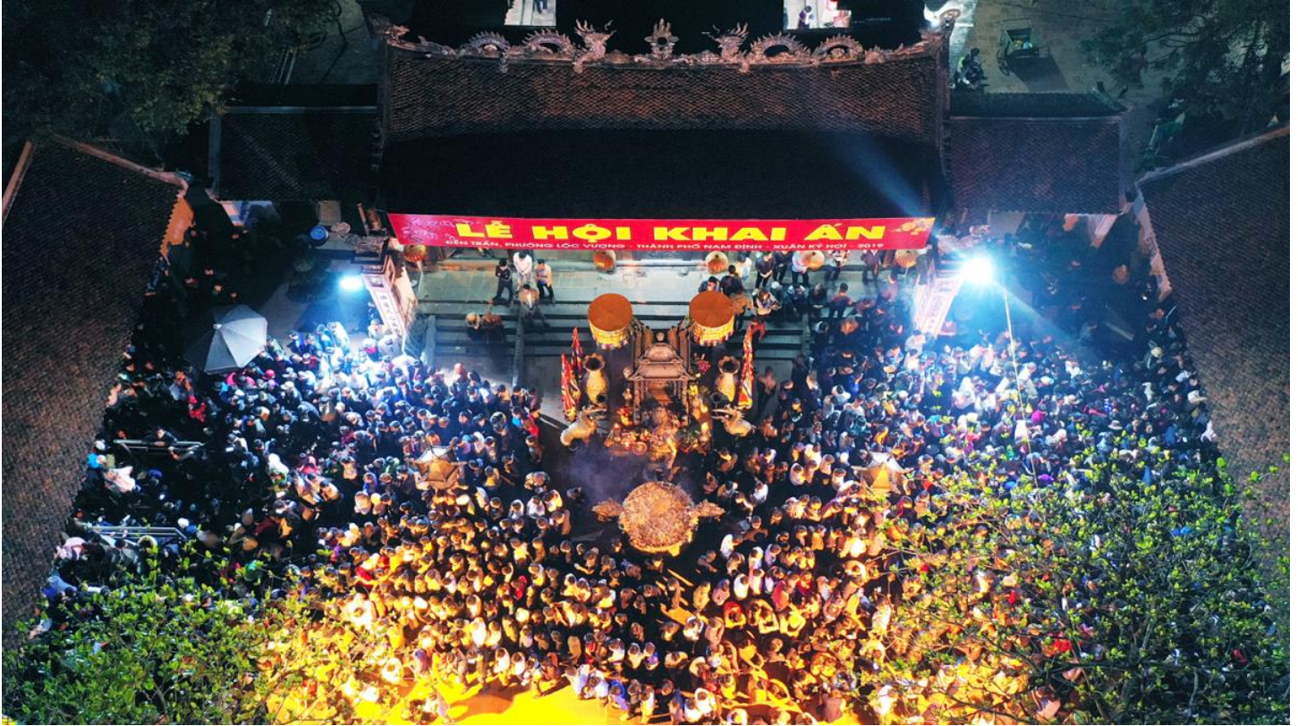
Lễ Khai Ấn đền Trần luôn thu hút đông đảo khách ghé thăm.

phương ghé thăm nơi này nhất, vì tham gia lễ Khai Ấn nổi tiếng. Sự kiện này diễn ra từ đêm 14 tháng giêng âm lịch, với nghi thức dâng hương, rước kiệu với nghi thức khai ấn là quan trọng nhất. Đoàn rước đến đền Thiên Trường đúng giờ Tý (23h).