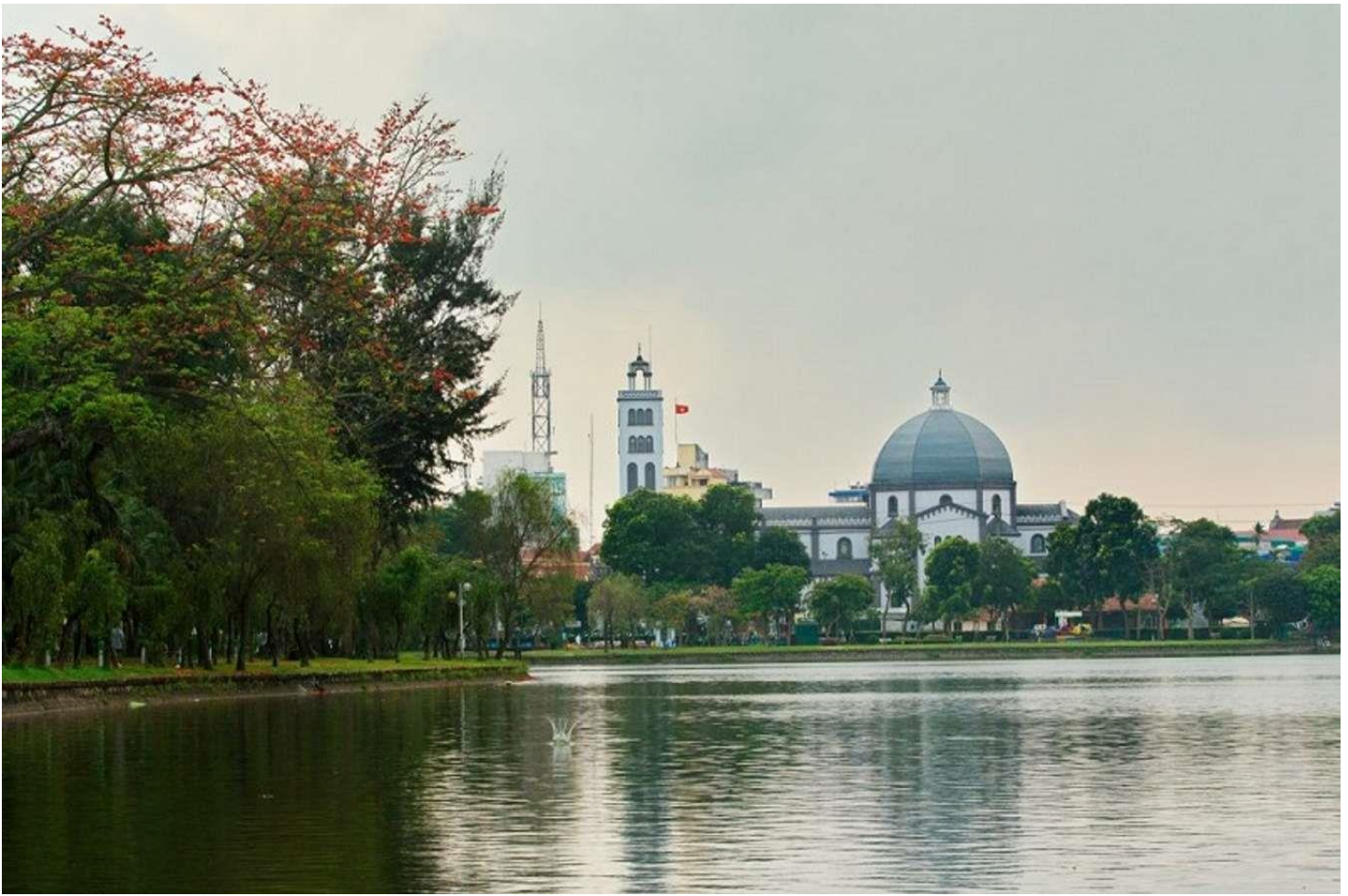
Hồ Vị Xuyên ở Nam Định yên ả và cổ kính.