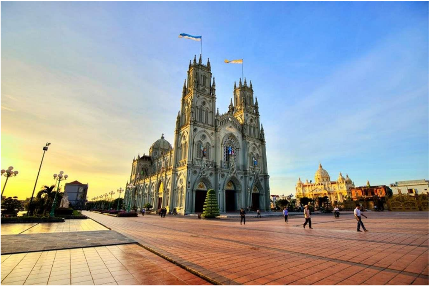
Nhà thờ Hưng Nghĩa sở hữu nét kiến trúc cổ kính của phương Tây.