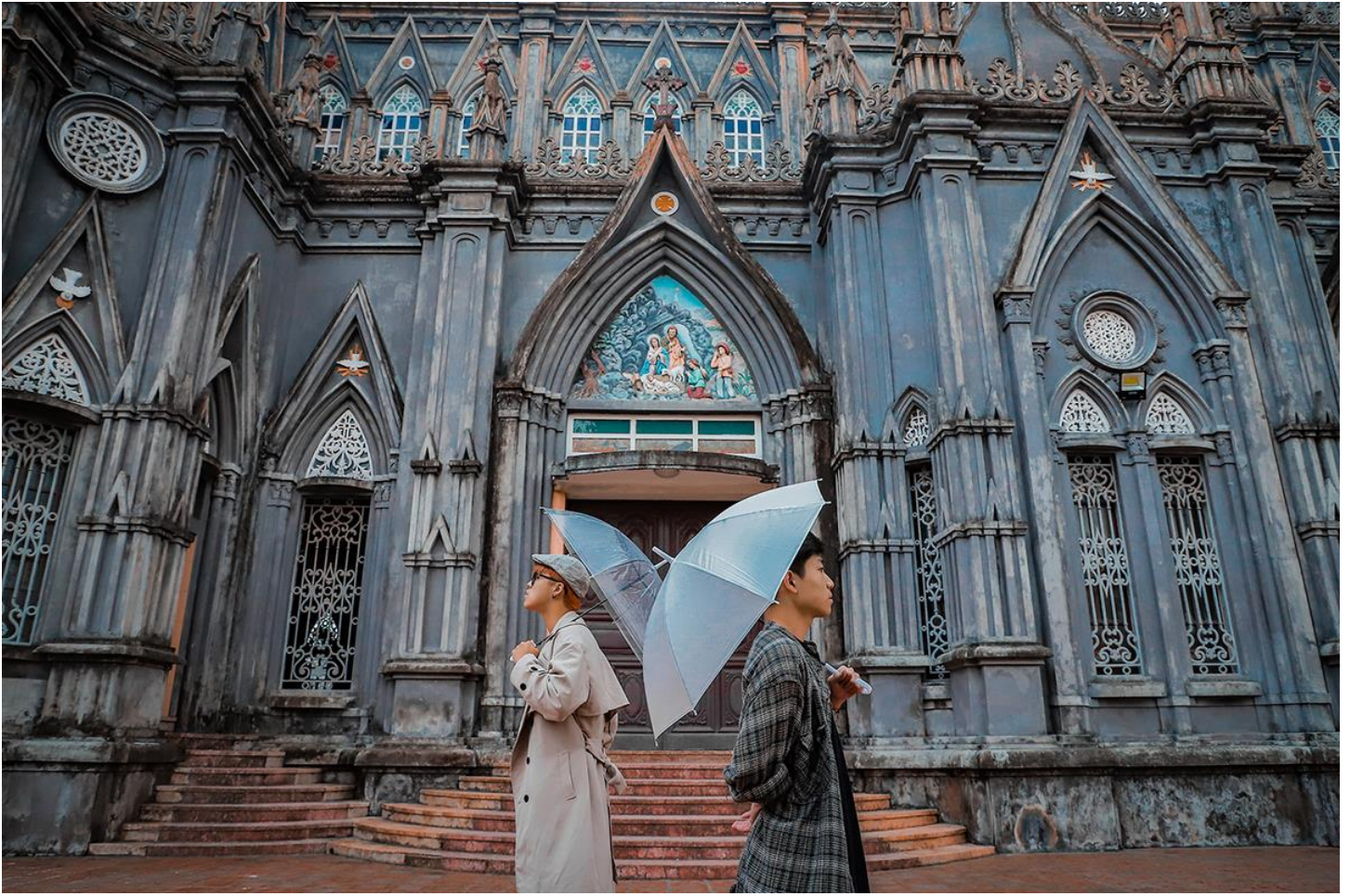
Phần lớn các nhà thờ đều nằm ở huyện Xuân Trường.